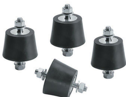
KIT ANTI 6