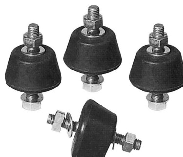
KIT ANTI 7