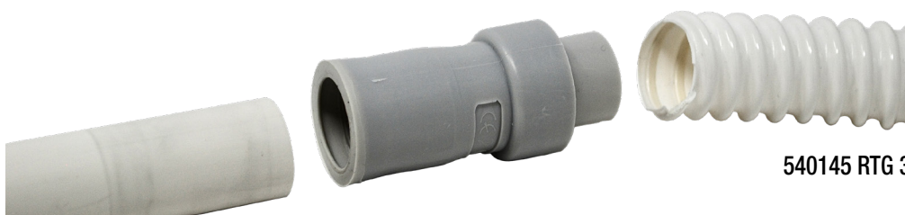
540145 RTG 3