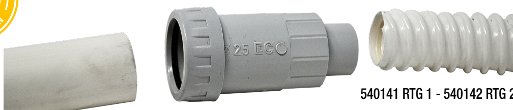
540141 RTG 1 - 540142 RTG 2