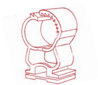
G-Clip multidiametro in Nylon!

G-Clip: Multidiametro, resistenti e veloci.